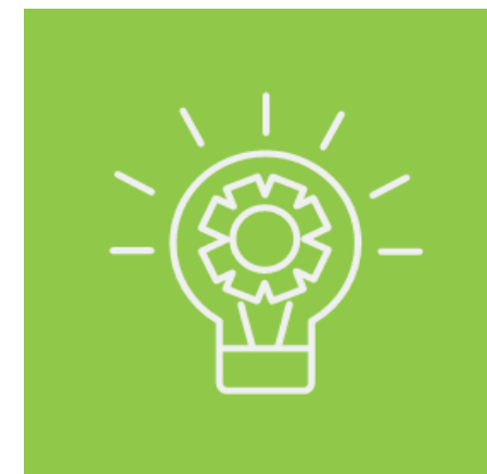
Ambiente de Negócios